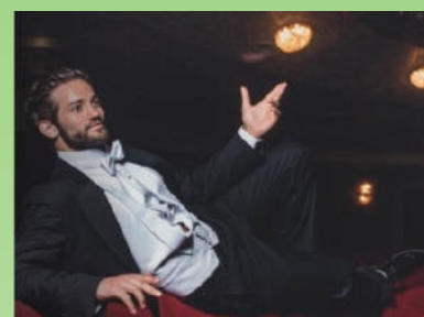
Musical & More