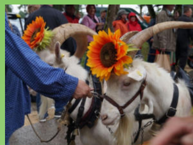
22. Illertisser Gartenlust