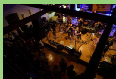
5. Illertisser Musiknacht